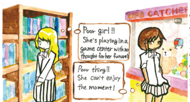
© Yusuke Enya: Student in the 6-year Program